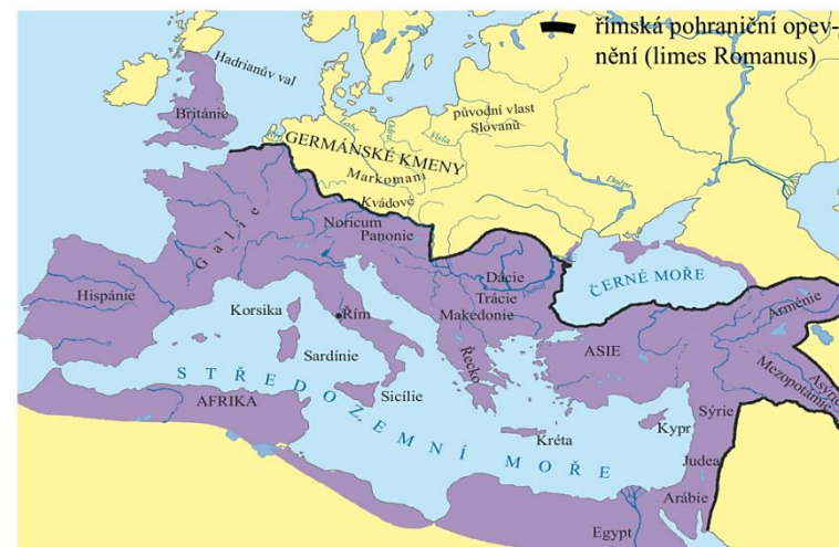
Největší rozloha římské říše za císaře Traiana